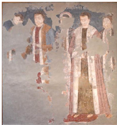
Fig. 1. Ctitorii bisericii Crețești (Muzeul de Artă Craiova).

Hrisovul din 29 octombrie 1609, menționează cum domnitorul Radu Șerban a hotărât ca cele două mănăstiri să-și împartă satul Povarul, astăzi dispărut.