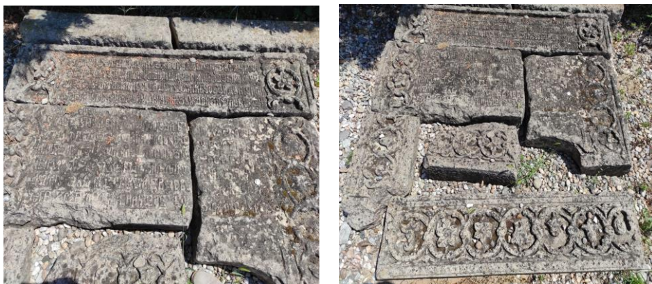
Fig. 3–6. Pisania bisericii de la Crețești aflată la Muzeul Olteniei din Craiova.