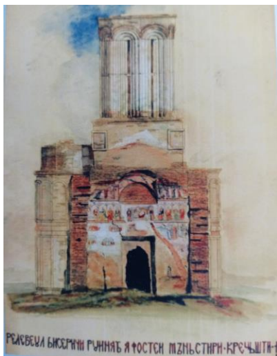
Fig. 2. Releveul bisericii fostei mănăstiri Crețești.

La 15 aprilie 1644, litigiul iscat între Barbu Brădescu paharnic și nepotul său, Balica paharnic s-a încheiat, cei doi mari boieri primind, prin poruncă domnească următoarele: Barbu Brădescu – Tejiacul, Slatina, Curâia și Zăgoreni; Balica paharnic – jumătate din alte 4 sate: Crețești, Breasta, Căpinteni și Valea Lungă.