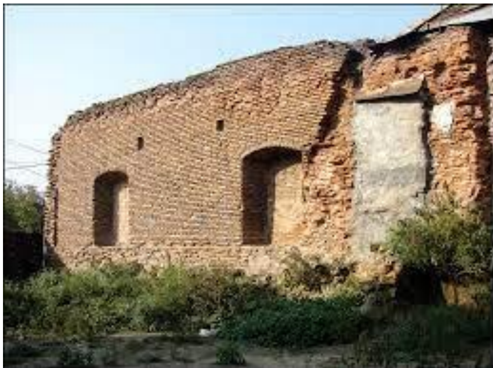
Fig. 3. Zidul rămas în zilele noastre din ansamblul Hanului Hurez.

ales, nu era îndeajuns pentru retragerea tuturor boierilor cu averile lor, în caz de război. Un alt motiv era costul redus de fortificare, suma totală fiind de 3250 fl. Fortificația urma să fie formată dintr-un șanț, lucrat încetul cu încetul, și palisade, fără multe umbre 8 . Despre aceste două mari construcții a lăsat considerații argumentate istoricul Alexandru. A. Vasilescu 9 . El susține că, deși ambele sunt realizate de Constantin Vodă Brâncoveanul, doar cele aflate într-un anumit areal sunt considerate ale banilor (Casele Băniei, biserica Sf. Dumitru, Hanul Hurezi) 10 .