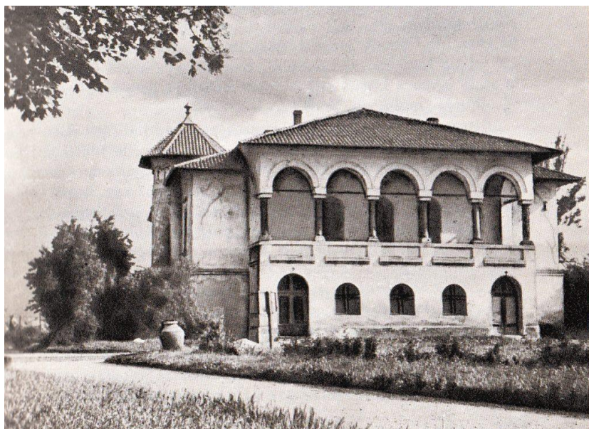
Fig. 1. Casa Băniei.

Casa Băniei reprezintă în Craiova cea mai veche clădire civilă din oraș. Ea a reprezentat sediul Marilor Bani de a lungul timpului, locul de unde administrarea Olteniei pornea și înceta. Casa a fost reconstruită în anul 1699, de către Constantin Brâncoveanu, pe locul fostelor case ale boierilor Craiovești din secolul al XV-lea. Casa Băniei se află situată în zona centrală a orașului, în imediata apropiere a Catedralei Mitropoliei Sf. Dumitru și în apropierea Monumentului Frații Buzești, în partea nordică a Parcului Sf. Dumitru (Grădina Băniei, Grădina Trandafirilor sau Parcul Frații Buzești). După cele mai multe opinii istoriografice, casele bănești cele dintâi ar fi fost ctitoria marelui ban Barbu Craiovescu, fiul cel mai mare al lui Neagoe de la Craiova, întemeietorul familiei Craioveștilor. Casele, construite în centrul vechi al Craiovei, lângă Biserica Sf. Dumitru (fostă Biserica Băneasa sau Biserica Domnească), pe locul altor clădiri boierești mai vechi, au servit drept reședință a banilor și loc de adunare a Divanului Craiovei.