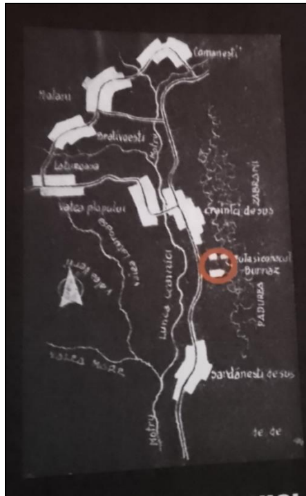
Fig. 2. Zona de vizibilitate a culei Burnaz din Crainici (apud Iancu Atanasescu, Pavel Popescu, Culele din Oltenia cu evoluția lor până în 2010 , Craiova, f.e., 2012, p. 259).

Ca toate culele, construcția de la Crainici avea o formă adecvată apărării, zidurile având creneluri prin care se putea trage cu pușca și pistolul către asediați. Aceste creneluri erau prezente în părțile unde terenul era mai coborât, nefiind necesare acolo unde apărarea era facilitată de pădurea din apropiere.