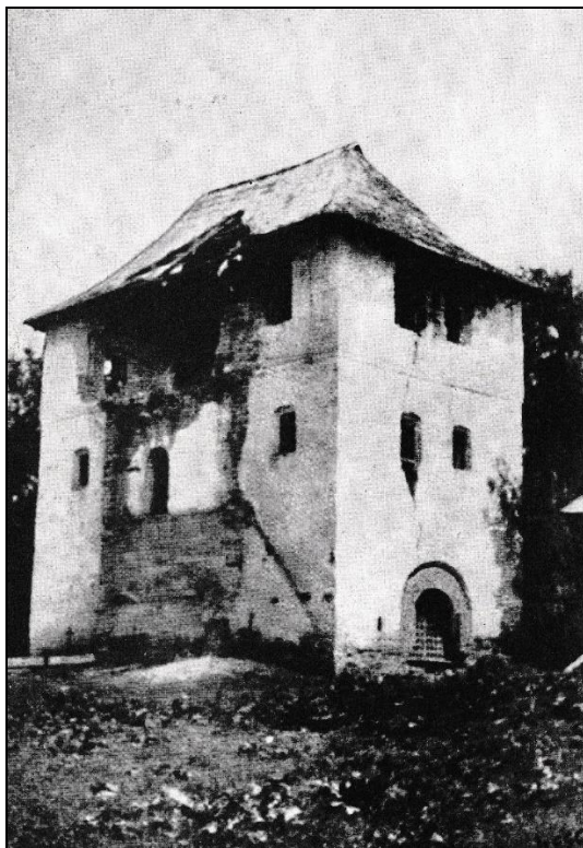
Fig. 1. Cula din satul Crainici, județul Mehedinți (apud Ion Godea, Culele din România, tezaur de arhitectură românească , Timișoara, 2006, p. 45).

Informația oferită de cunoscutul arhitect este contrazisă de alți specialiști. Ion Florescu 15 și mai târziu Radu Crețeanu 16 și Ion Godea 17 , bazându-se pe o fotografie realizată în anul 1925 (fig. 1) și pusă la dispoziție de Gheorghe Dumitrescu, ultimul proprietar al culei, susțin că această construcție nu a fost demolată în 1903, ci la o dată ulterioară care însă nu este cunoscută.