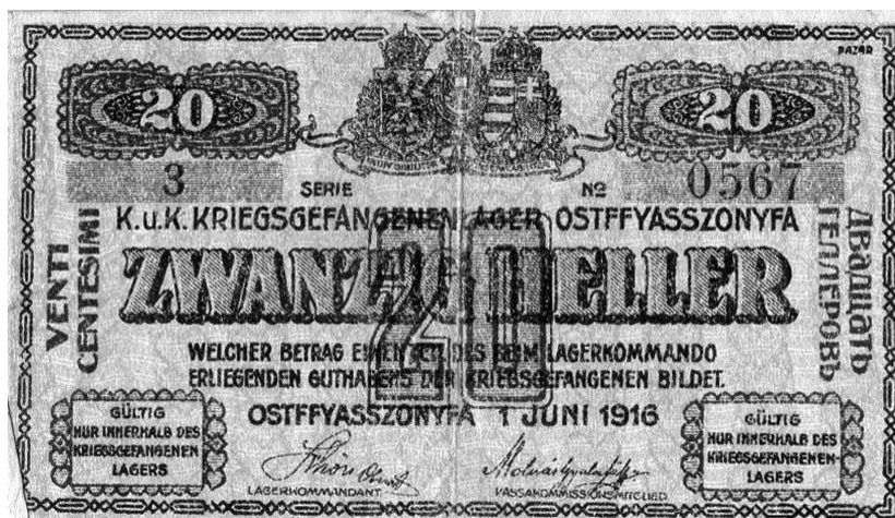
Figura 4. 1917, septembrie 24, Ostffyasszanifa. Banii prizonierilor.

„24. sept. Ni se iau banii ce-i avem, dându-ni-se niște chitanțe cu dreptul de a lua din ei, la 10 zile, câte 20 de koroane, dar banii sunt românești și deci nu merg, ni se da însă în contul lor până la 60%. În acest lagăr, vom face o carantină de 7 zile, când vom fi duși în alt lagăr de prizonieri. Banii ce ni se dau, nu sunt bani adevărați, ci niște bani de lagăr, de 10, 20 bani și 1, 2, 5, și 10 franci, care nu merg decât în acest lagăr. Banii sunt ca cei ce se văd:”